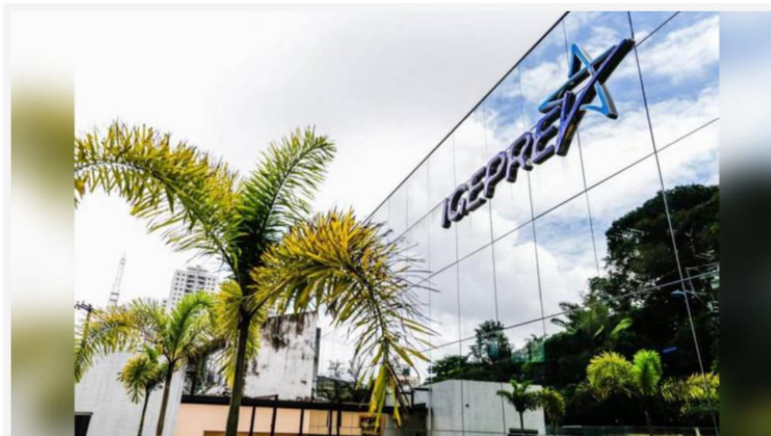
📍 Vagas são para Belém, Castanhal, Abaetetuba, Capanema, Santarém, Altamira e Marabá | Pedro Guerreiro - Agência Pará

O Instituto de Gestão Previdenciária do Estado do Pará (Igeprev), autarquia estadual, com sede e foro na Capital do Estado do Pará, vinculada à Secretaria Especial de Estado de Gestão. A finalidade do instituto é gerir os benefícios previdenciários do Regime de Previdência Estadual e dos Fundos Financeiro de Previdência e Previdenciário do Estado do Pará.