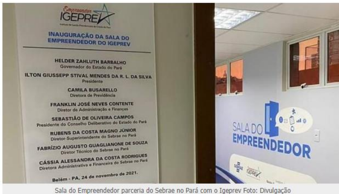
Sala do Empreendedor parceria do Sebrae no Pará com o Igeprev