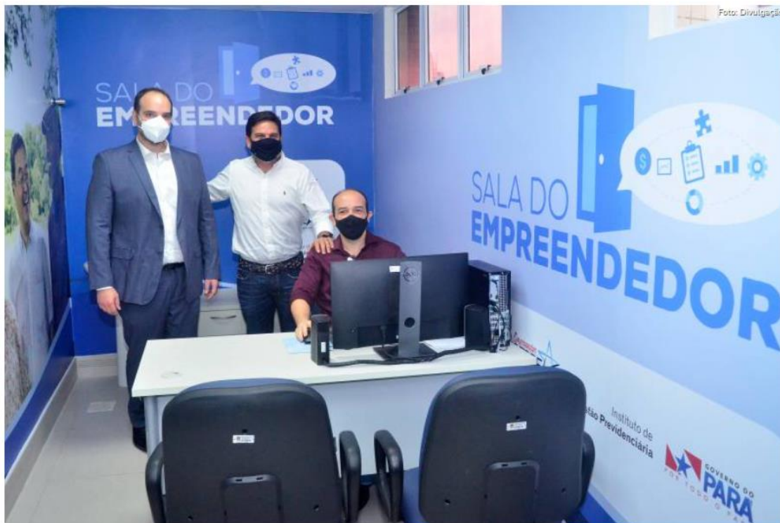
Na Sala do Empreendedor haverá consultoria técnica para aposentados e pensionistas que possuem pequenos negócios

O Instituto de Gestão Previdenciária do Estado do Pará (Igeprev) inaugurou, nesta quarta-feira (24), a Sala do Empreendedor em sua sede, em Belém. A iniciativa faz parte do Projeto Empreender, executado em parceria com o Serviço Brasileiro de Apoio às Micro e Pequenas Empresas (Sebrae-PA), que pela primeira firma essa parceria na esfera estadual.