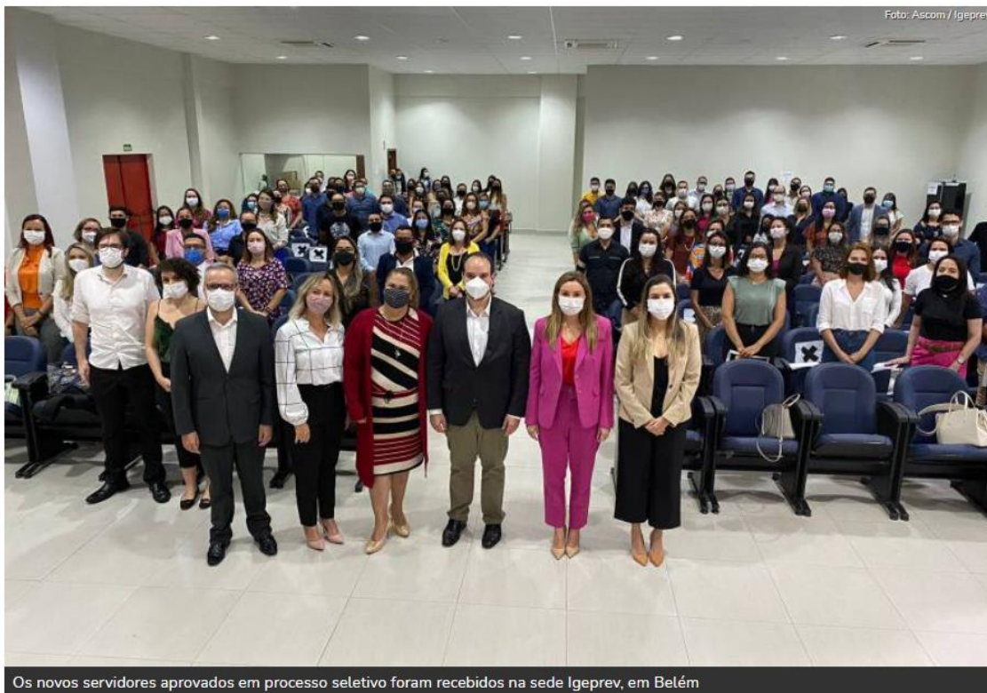
Os novos servidores aprovados em processo seletivo foram recebidos na sede Igeprev, em Belém

Na próxima sexta-feira (26) será encerrado o período de ambientação, e os novos contratados deverão ser lotados nos setores para o início de suas atividades ainda em novembro.