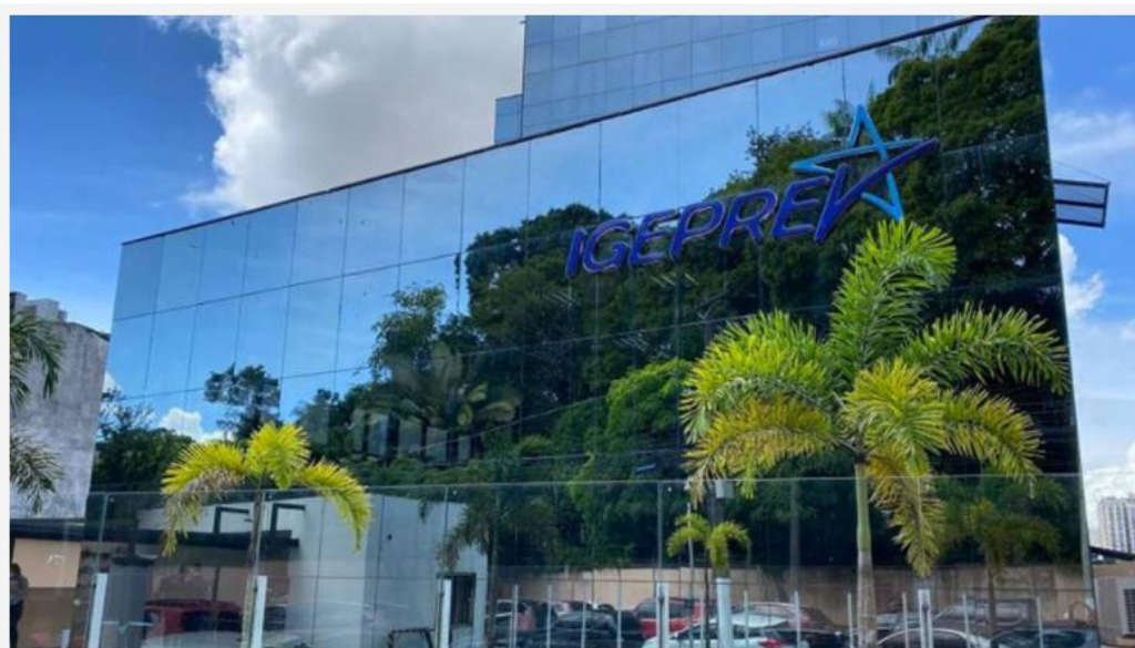
📷 O não comparecimento ao censo previdenciário tem como consequência o cancelamento do benefício