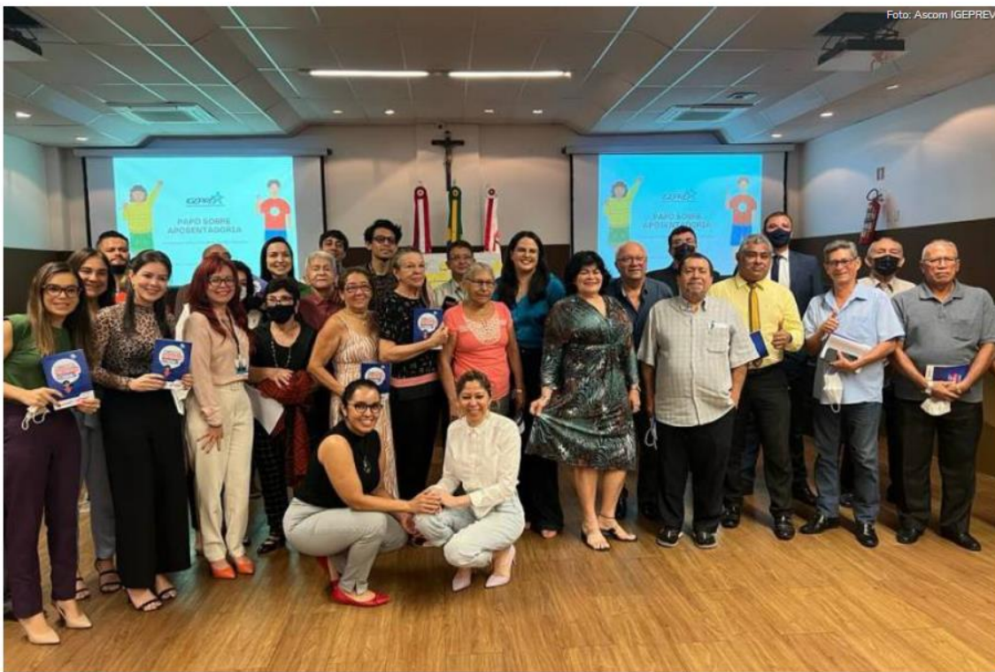
Servidores do TCE participam de projeto coordenado pelo Igeprev.

26/05/2022 09h48 - Atualizada em 26/05/2022 09h56