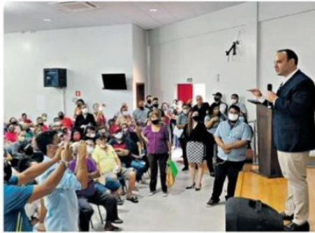
O presidente do Igprev explicou aos beneficiários que o novo prazo para atualizar os dados cadastrais vai até o fim de julho